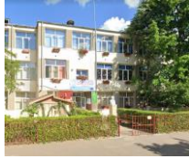
Școala Gimnazială "George Tutoveanu" Bârlad